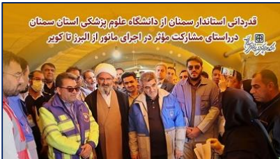
قدردانی استاندار سمنان از دانشگاه علوم پزشکی استان سمنان در راستای مشارکت مؤثر در اجرای مانور از البرز تا کویر ۱۴۰۴/۱۰/۱۶