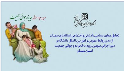
تجلیل استانداری سمنان از دبیر اجرایی سومین رویداد خانواده و جوای جمعیت استان سمنان ۱۴۰۴/۱۰/۱۷