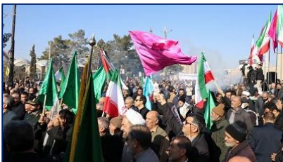
حضور پرشور خانواده بزرگ دانشگاه علوم پزشکی استان سمنان در اجتماع مردمی حمایت از امنیت و آرامش ایران اسلامی ۱۴۰۴/۱۰/۲۱