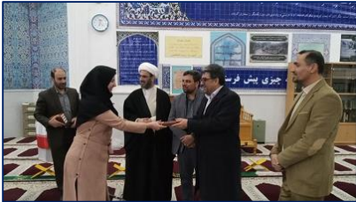
اختتامیه مراسم معنوی اعتکاف دانشگاه علوم پزشکی استان سمنان برگزار شد ۱۴۰۴/۱۰/۱۶