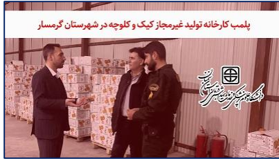
پلمب کارخانه تولید غیرمجاز کیک و کلوچه در شهرستان گرمسار

سرپرست معاونت غذا و دارو دانشگاه از پلمب یک کارخانه غیرمجاز تولید کیک و کلوچه خبر داد ۱۴۰۴/۱۰/۰۸